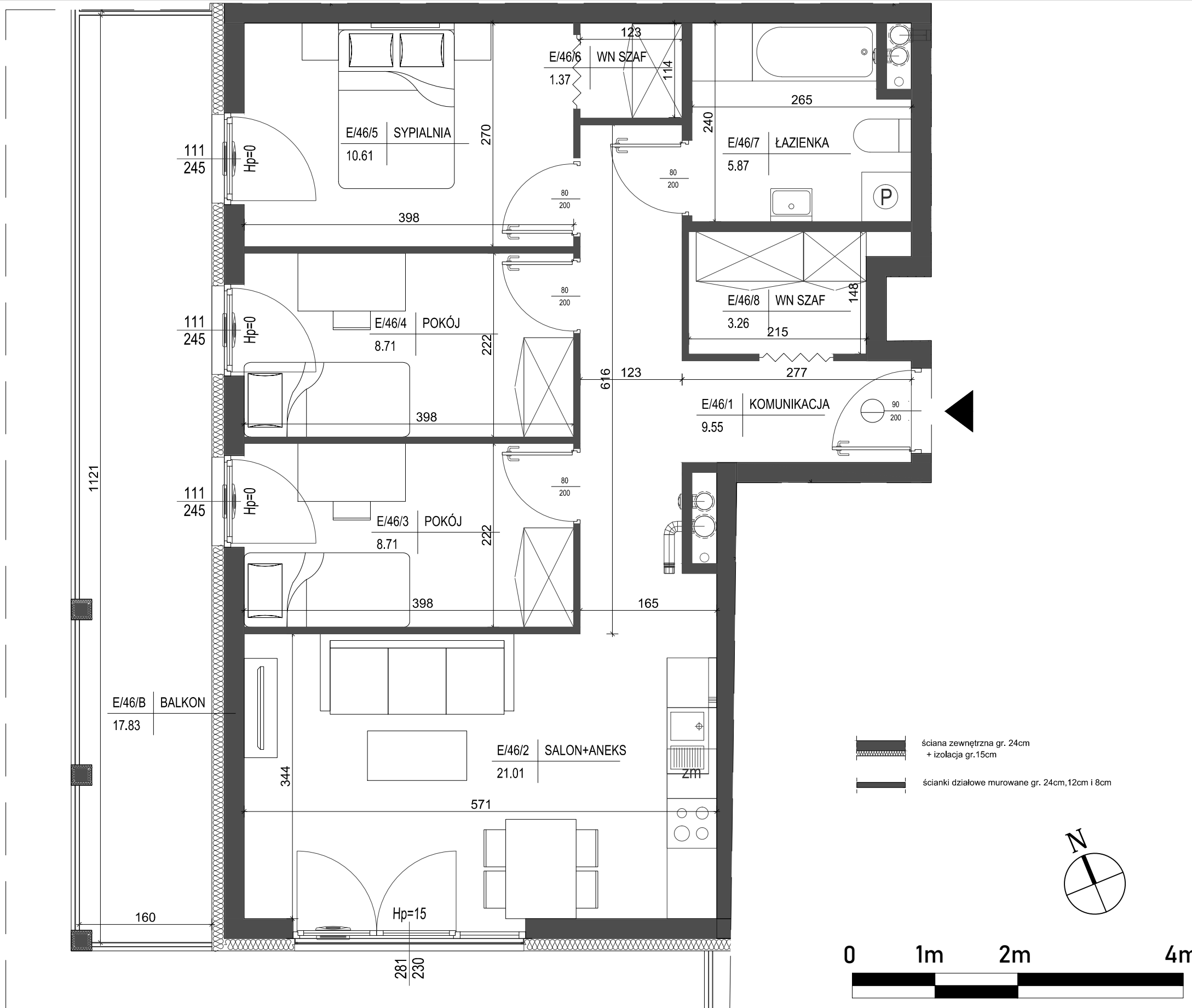
IV piętro lokalizacja mieszkania