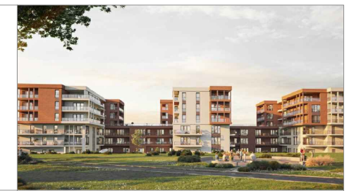
parter lokalizacja lokalu